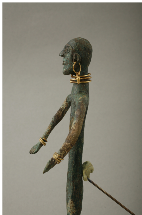
© Miriam Kiladze - Georgian National Museum