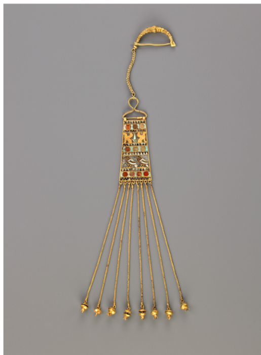
Polychrome Pectoral with Griffins and Birds Achaemenid and Colchian, First half of 4th century BC coll.