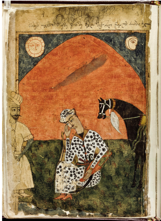
Shota Rustaveli, "The Man in the Panther's Skin", 1646 ; Copyist and illustrator Mamuka Tavakarashvili