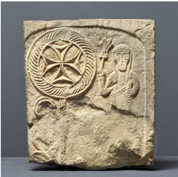
Fragment of a stele, 6th century, © Bryan Whitney Georgian National Museum