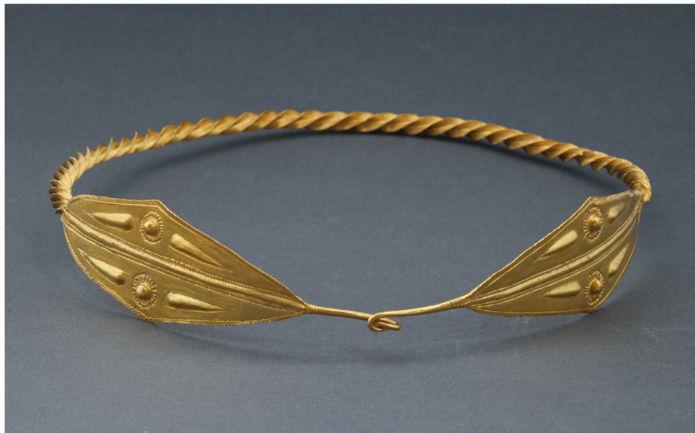
Diadem, 5th c.BC, Sairkhe Fine Arts Musuem