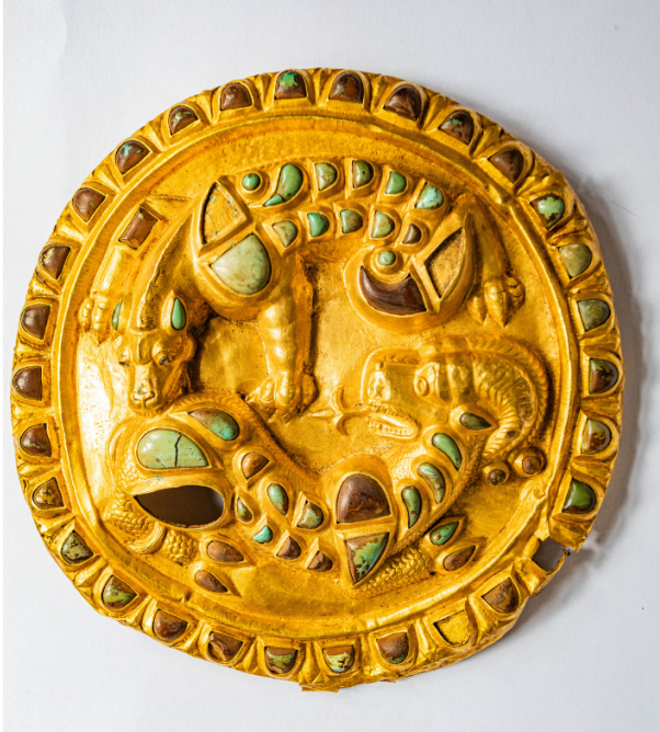
Gold disc, Gonio, 1st - 2nd century.