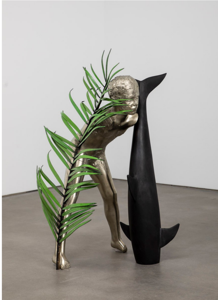
Andro Wekua, Us, 2019 © Andro Wekua