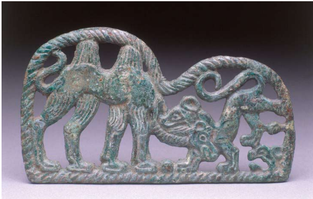
Plaque en bronze avec chameau et tigre, Xiongnu, II e - I er siècle avant notre ère, Musée de la bannière de Balinzuo Nous trouvons ici un style animalier caractéristique des steppes.

Lors d'une campagne contre les Xiongnu, l'empereur Wudi, contraint de chercher de nouveaux alliés, envoie, vers 138 avant notre ère, un jeune officier de la cour, Zhang Qian, sur les routes de l'Ouest. Rapidement fait prisonnier par les Xiongnu, Zhang Qian s'évade dix ans plus tard et reprend sa quête qui le mène dans la vallée fertile du Ferghana où il admire pour la première fois les chevaux « célestes ». De retour à la cour impériale après treize ans, Zhang Qian vante les nouvelles contrées, les monnaies d'argent des Parthes d'Iran, les pierres précieuses du Khotan et les fabuleux chevaux