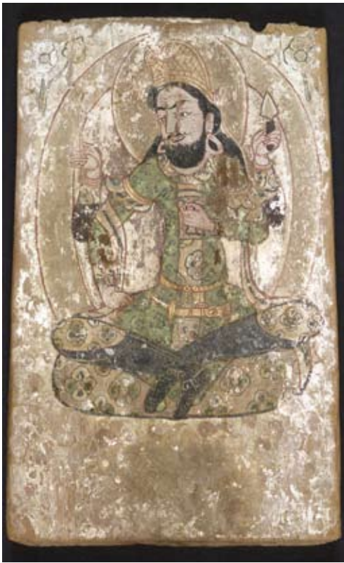
Panneau votif. VIe siècle. Exhumé par Aurel Stein en 1900, Dandan-Uiliq, Khotan Encre et pigments sur bois, H. 33 cm, l. 20 cm London, The British Museum, 1907.1111.71 (D.VIII.6)

Sur ce panneau votif est représenté le dieu de la soie à quatre bras. Nous voyons un personnage barbu, couronné, assis sur un coussin de fleurs et vêtu d'un habit de cour et d'un long pantalon. L'une des mains inférieures repose sur le genou tandis que l'autre tient un gobelet. La main supérieure gauche brandit un peigne à tisser ; la quatrième main enserre une navette. Cette représentation montre de nombreuses similitudes avec les miniatures persanes des siècles ultérieurs.