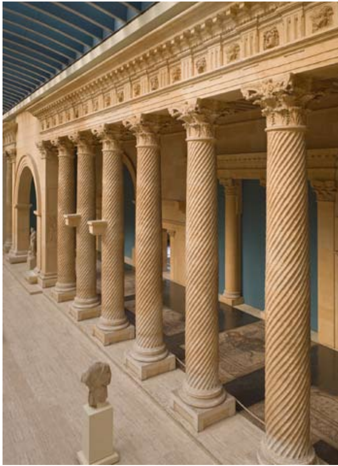
Reconstitution de la colonnade d'Apamée, II e s de notre ère, MRAH

Fondé pour les colons grecs par les Séleucides, Apamée-sur-l'Oronte, devient romaine lorsque toute la Syrie est conquise au I er siècle avant notre ère. Reconstituée au II e siècle, après un tremblement de terre, Apamée présente un plan d'urbanisme repris aux Grecs. La « Grande Colonnade » s'étirait sur près de 2 km du Nord au Sud de la ville. Large de 7,5m, ce portique pavé de mosaïques datées de 469, témoigne de la prospérité économique de cette ville bien située le long des routes caravanières.