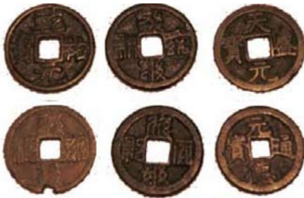
Monnaies Tangut s'inspirant de la tradition des pièces chinoises, XI e -XIII e siècle, Musée de la Province du Ningxia

On trouve également des monnaies étrangères, notamment des drachmes sassanides ou des pièces byzantines mais aussi des imitations locales. Celles-ci s'inspirent soit de la tradition chinoise, soit de la tradition occidentale, soit sont une combinaison des deux. Certains textiles pouvaient aussi faire office de monnaie, notamment pour payer un impôt.