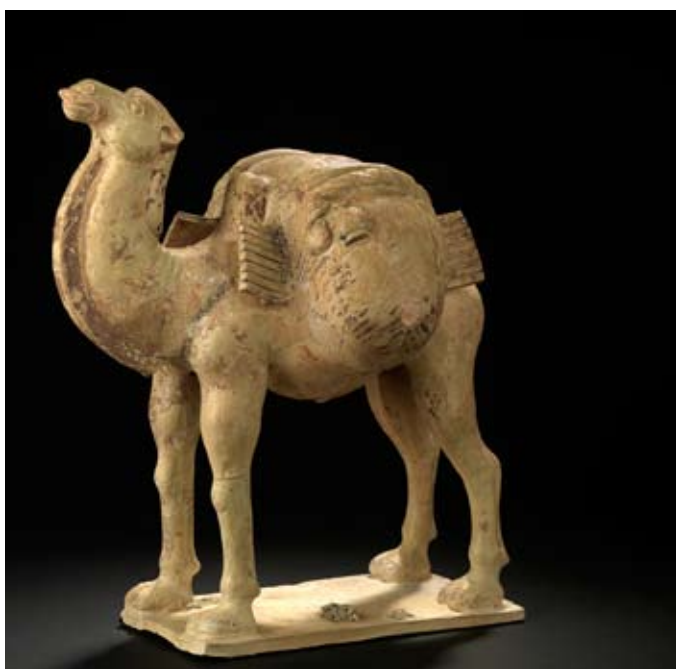
Chameau chargé, terre cuite avec traces de glaçure brun-foncé, Chine, dynastie Tang (618-906) MRAH, Inv. E.O.931.

... La Chine est la plus sûre ainsi que la meilleure de toutes les régions de la terre pour celui qui voyage. On peut parcourir tout seul l'espace de neuf mois de marche sans avoir rien à craindre, même si l'on est chargé de trésors. C'est que dans chaque station il y a une hôtellerie surveillée par un officier, qui est établi dans la localité avec une troupe de cavaliers et de fantassins. Tous les soirs, après le coucher du soleil, ou après la nuit close, l'officier entre dans l'auberge, accompagné de son secrétaire ; il écrit le nom de tous les étrangers qui doivent y passer la nuit, en cachette la liste, et puis ferme sur eux la porte de l'hôtellerie. Le matin, il y retourne avec son secrétaire, il appelle tout le monde par son nom, et en écrit une note détaillée. Il expédie avec les voyageurs une personne chargée de les conduire à la station qui vient après, et de lui apporter une lettre de l'officier proposé à cette seconde station, établissant que tous y sont arrivés ; sans cela ladite personne en est responsable. C'est ainsi que l'on en use dans toutes les stations de ce pays... —Ibn Battuta, XIV e siècle, Voyages, p.322.