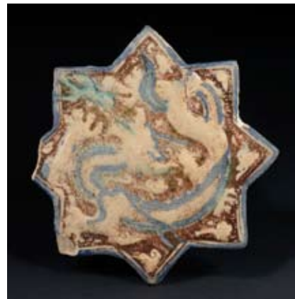
Carreau avec dragon, céramique, Iran, XIII e -XIV e siècle, MRAH, Inv.IS.13 Arabes, Persans, Chinois, Indiens... diffusent à chaque passage de nouvelles techniques, idées et motifs iconographiques. Le dragon, emblème traditionnel de l'autorité impériale en Chine, devient un motif largement répandu dans le répertoire iconographique islamique.