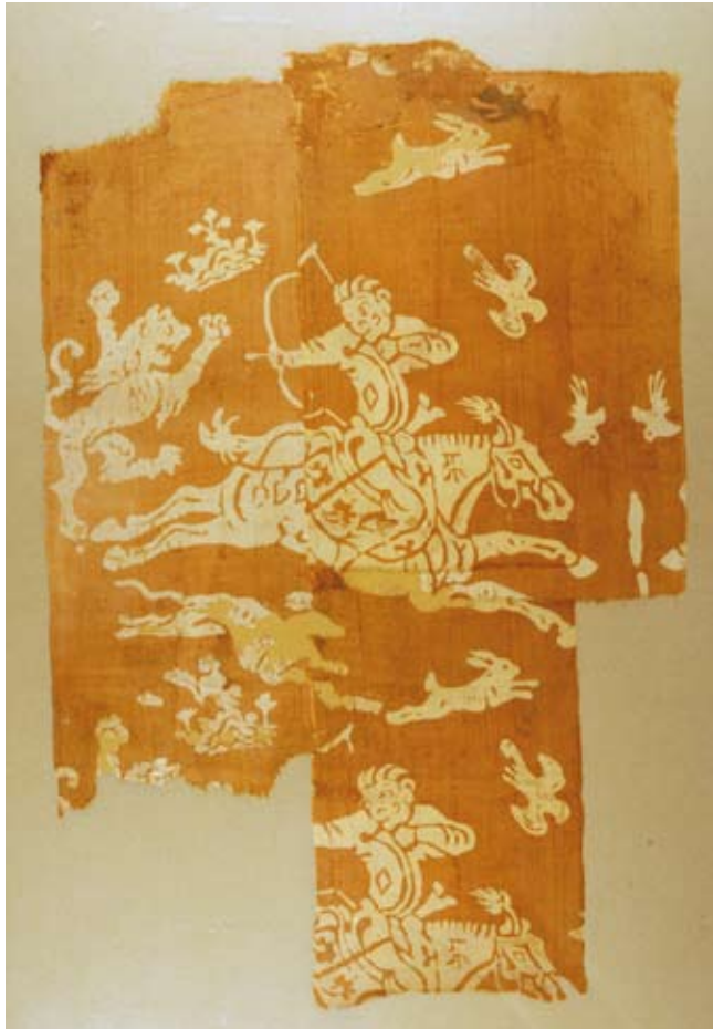
Tissu de soie avec scène de chasse, VIIe-VIIIe siècle Exhumé en 1973, tombe 119, Astana, Turfan, H. 44 cm, l. 29 cm Urumqi, Musée de la Région autonome ouïgoure du Xinjiang, XB 10460

À partir du Khotan, la connaissance du procédé se diffusa, au IVe siècle, dans l'empire romain d'Orient d'où il fallut encore attendre environ 500 ans avant que le savoir-faire n'atteignit l'Europe occidentale.