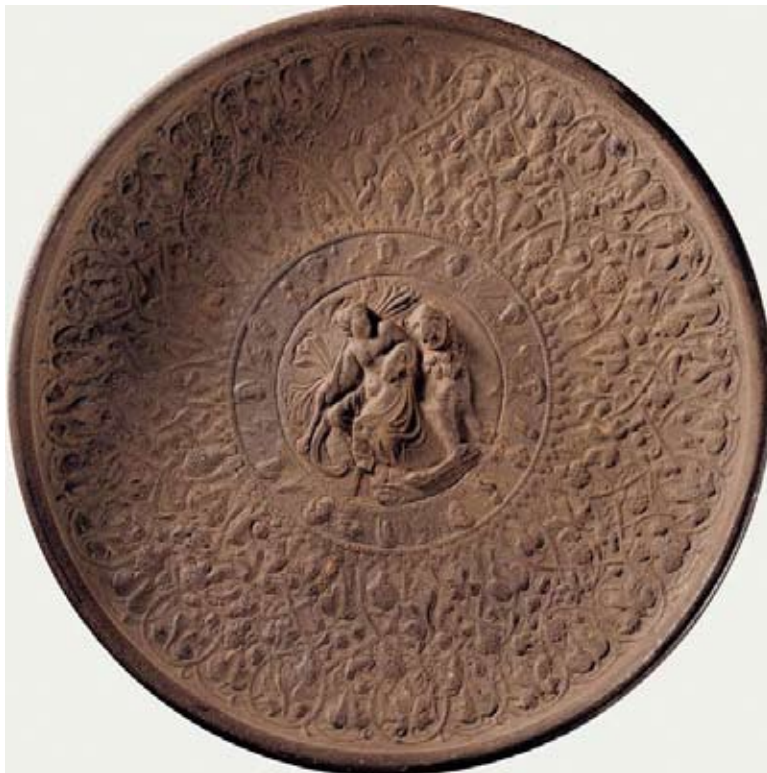
Plat avec Dionysos, II e ou III e siècle, argent doré, trouvé à Lanzhou. Lanzhou, Musée de la Province de Gansu Provenant d'une province orientale de l'Empire romain, ce plat acheminé par les routes commerciales est décoré de Dionysos entouré de dieux grecs. Divers motifs classiques de grappes, feuillages de vigne, d'oiseaux encerclent le médaillon central.

Les premiers ponts furent jetés dans l'Antiquité lorsqu' Alexandre le Grand engagea, vers le milieu du IV e siècle avant notre ère, des conquêtes qui le menèrent jusqu'en Asie Centrale. Son empire s'étendra