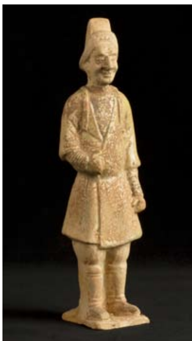
Étranger, Chine, dynastie Tang (618-906), MRAH, Inv. EO. 883

Ce monde pittoresque fut une source d'inspiration pour les sculpteurs qui ont traduit dans leurs œuvres les petits détails de la vie quotidienne.