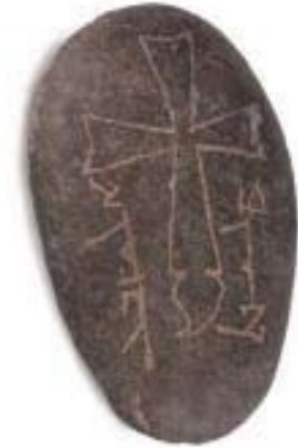
Pierre tombale nestorienne, pierre, vallée de l'Ili, XII e - XIV e siècle. Urumqi, Musée de la région autonome ouïghoure

Le « succès » du nestorianisme est dû à sa capacité d'adaptation aux cultures rencontrées. En se « sinisant » il a pu se propager dans plusieurs provinces chinoises. Avec l'arrivée au pouvoir des Ming (1368-1644), les étrangers furent chassés et l'église nestorienne s'effondra.