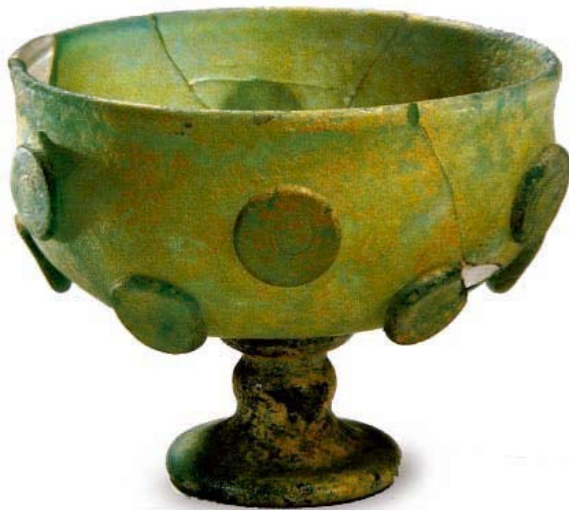
Gobelet en verre sassanide Vers le VI e siècle Découvert en 1989, grotte Simsim, Kucha H. 9,7 cm, Ø 12,1 cm Urumqi, Musée de la Région autonome ouïgoure du Xinjiang, XB 12950

Le premier verre islamique en Chine date de la dynastie des Tang.