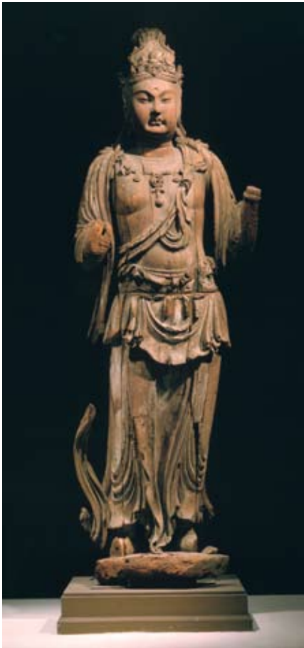
Bodhisattva, Vers 1200 Bois avec traces de polychromie Shanxi, région autour de Linfen Musées royaux d'Art et d'Histoire, Inv. EO.1993

prochains sur le difficile chemin de cette libération. Le bouddhisme mahayana véhicule de nombreux usages qui sont mieux perçus par le grand public, tels que la divinisation du Bouddha, la croyance au ciel et à l'enfer, l'introduction d'un grand nombre de déités et d'esprits suivant l'exemple de l'hindouisme. Cette école accorde un grand intérêt au rituel et adopte un culte avec encens, bougies et eau bénite. Ce mouvement s'est répandu plus au nord, au Tibet, en Chine, en Corée et au Japon.