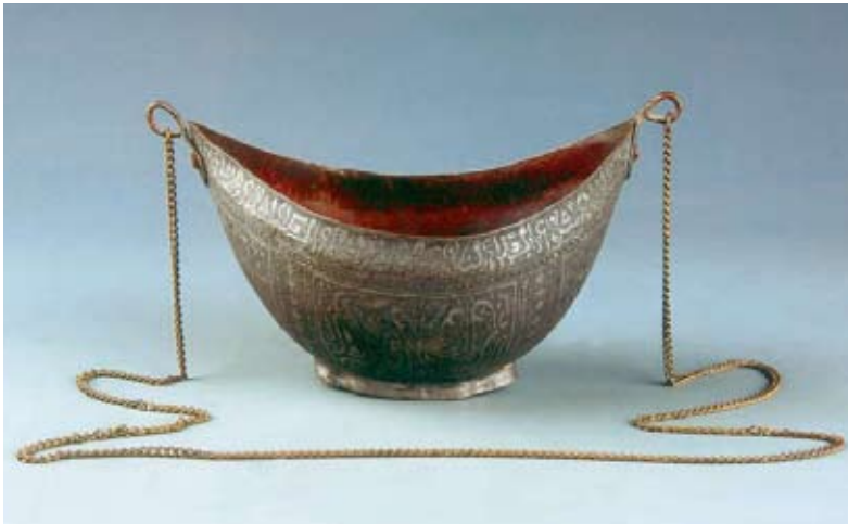
Sébile en argent, XIV e siècle, Kashgar, Musée de la Province du Ningxia

Au X e siècle, l'islam triomphe et contrôle donc, de fait, le commerce entre l'Orient et l'Occident, dominant ainsi une grande partie de l'économie. Des cités caravanières importantes, comme Boukhara et Samarkand, deviennent des centres islamiques réputés. Durant les siècles qui vont suivre, les routes caravanières resteront essentiellement aux mains des marchands islamiques. L'islam, devenu « la religion du commerce international », provoque la conversion de nombreux Chinois. Toutefois, à part dans le Turkestan chinois, l'islam ne fut jamais très répandu en Chine.