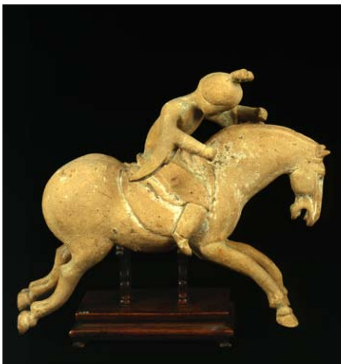
Joueuse de polo Terre cuite, Chine, dynastie des Tang (618-906), MRAH, Inv. E.O.2516, Landzou, Musée de la Province du Gansu

Sous la dynastie des Tang, l'élevage des chevaux s'est fortement développé. De plus, la Chine pouvait aussi compter sur un apport toujours renouvelé de tributs et de cadeaux en provenance de l'Ouest. Le cheval n'est pas utilisé seulement comme simple monture. À la cour de Perse où il est né, le polo, fait rage. Le premier empereur Tang, Taizong (629-649) fut conquis par ce nouveau sport lors d'une démonstration par des équipes du Turfan. L'empereur Xuanzong (712-755) encouragea à son tour le polo sur tout le territoire estimant qu'il est un excellent entraînement pour ses troupes. Quant à l'aristocratie, elle était friande de battues à cheval avec chiens ou guépards.