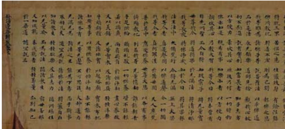
Sutra bouddhique chinois sur rouleau, Encre sur papier. H. 25 cm, l. 244 cm, VII e -IX e siècle, Lanzhou, Musée provincial du Gansu, 13131 Ce texte fut découvert en 1900 dans la grotte 17 à Dunhuang. Il concerne une version du Sutra du Lotus, l'un des textes religieux les plus influents du bouddhisme chinois. Les sutras se rapportent aux discours du Bouddha et aux récits sur ce dernier et sur ses disciples. Leur récitation est considérée comme un moyen d'acquiescer des mérites et de garantir une bonne renaissance.

Des données scientifiques plus complètes sur les découvertes de Dunhuang, auxquelles est consacrée une large part de l'exposition, peuvent être obtenues sur le site http://idp.bl.uk . On y trouve également de nombreuses illustrations et des rubriques spécialement destinées aux professeurs et aux étudiants.