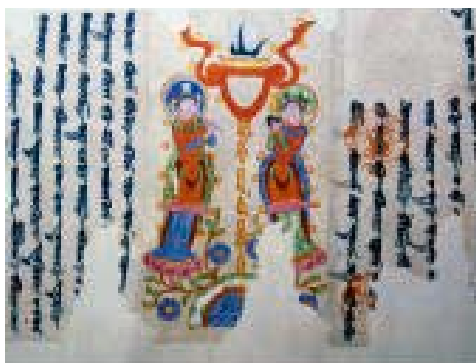
Lettre manichéenne, X e siècle, Tourfan, Xinjiang, Musée de Turfan Il s'agit ici d'une correspondance entre dirigeants locaux de l'église manichéenne. Les deux musiciens debout sur des lotus sont des prêtres manichéens.

Le zoroastrisme s'est diffusé en Chine au V e siècle de notre ère, avant d'être supplanté par l'islam. Il subsiste aujourd'hui des adeptes du zoroastrisme : les Guèbres et les Parsis. Les Guèbres, vivent dans la région de Yazd (Iran). Les Parsis sont des descendants de zoroastriens qui ont fui l'Iran après la conquête musulmane et se sont réfugiés principalement à Bombay. Le culte du feu occupe toujours une place importante dans le culte zoroastrien.