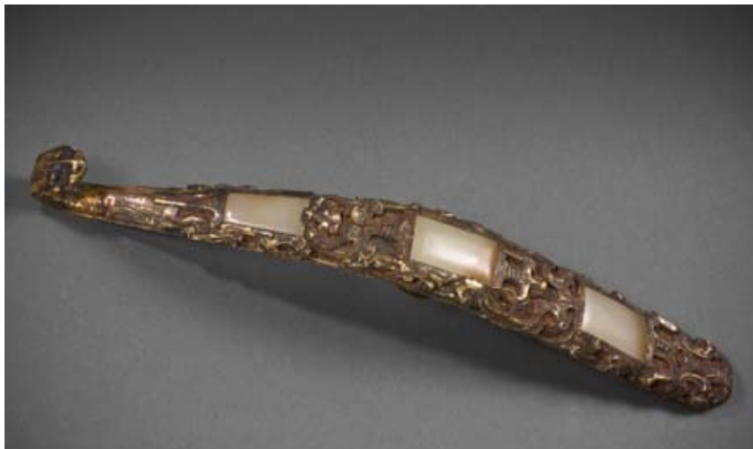
Crochet de ceinture serti de jade III e siècle avant notre ère Shaoguan Bronze, or et jade L. 21,7 cm Bruxelles, MRAH, L 229

Dans la langue chinoise, le mot « jade » est utilisé pour des choses précieuses et mystérieuses. C'est ainsi que l'on vénère également l' Empereur de Jade , divinité la plus élevée du panthéon taoïste.